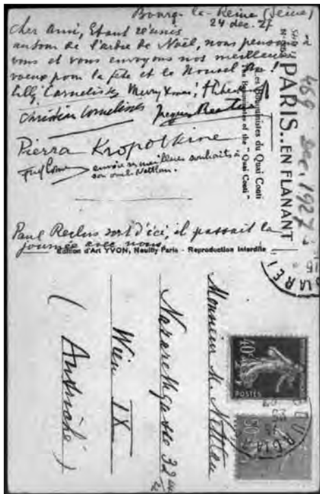
Max Nettlau Papers, n° 324 IISG Amsterdam