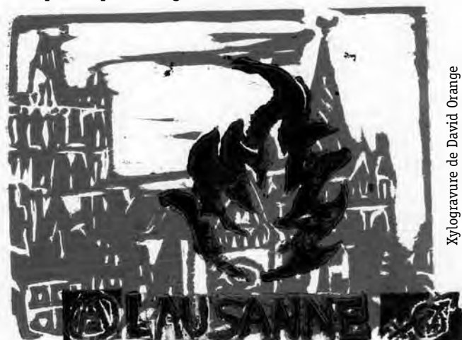
Xylogravure de David Orange