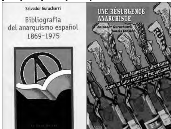
La Rosa de Foc, 2004.