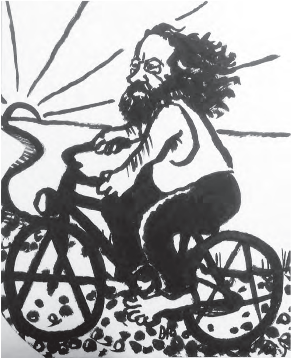
Bakounine sur la piste cyclable. Dessin de David Orange, 2015.