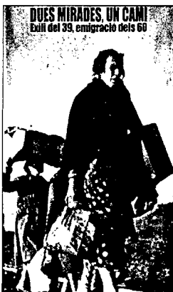
Documentaire de Pilar Molina, 2002.

Mais attention : nous ne sommes pas distributeurs de films !