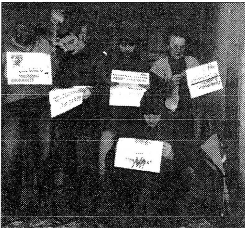
Pause studieuse devant la porte du CIRA.

2 Eine Kopie des Filmes, Bewegung in Blätterwald , gibt es im CIRA, avenue de Beaumont 24, CH-1012 Lausanne.