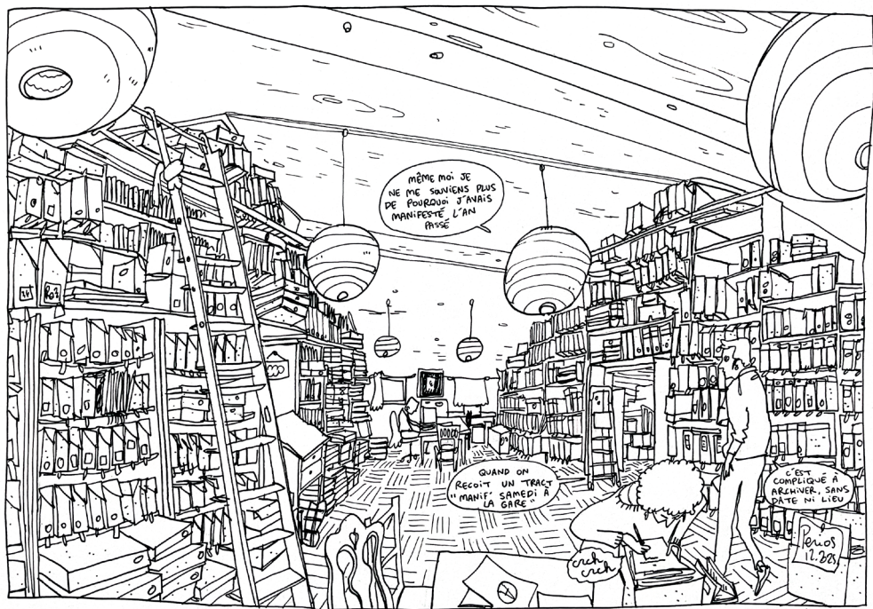
Dessin du 1 er étage du CIRA laissé par une visiteuse en février 2026.