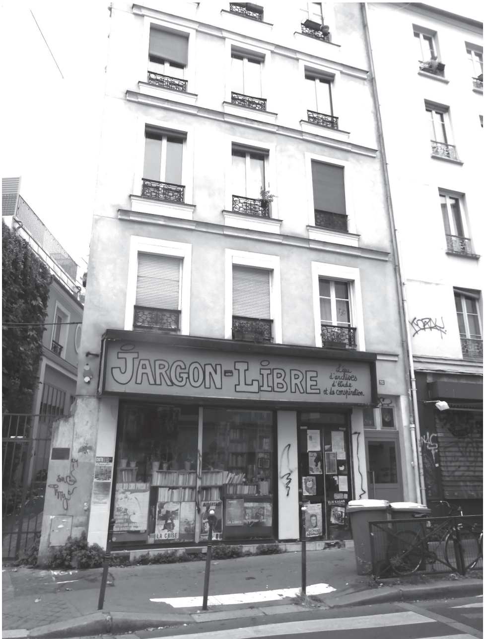
Vitrine du Jargon libre, 32, rue Henri Chevreau, Paris 20 e (2024).