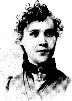
Voltairine de Cleyere Philadelphia 1891