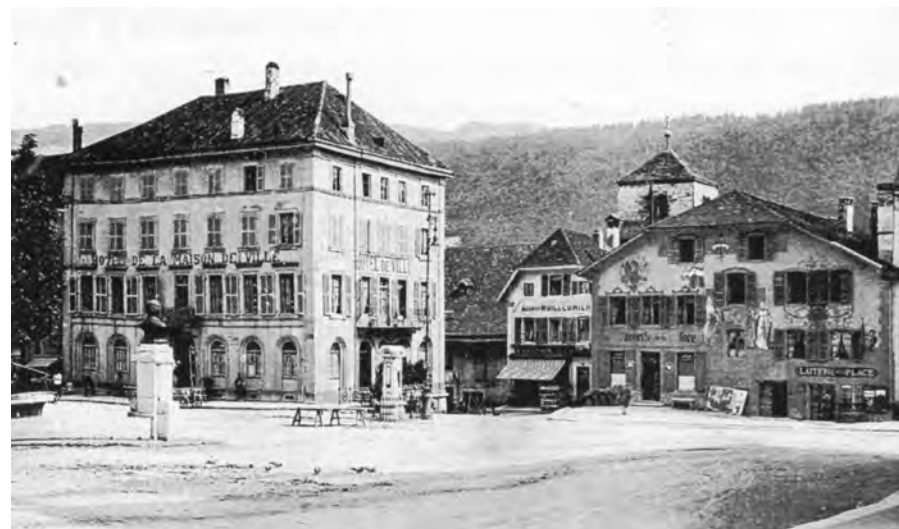
L'Hôtel de la Maison de Ville de Saint-Imier (aujourd'hui Hôtel Central), où se tint le congrès international anti-autoritaire en septembre 1872.

INTERNATIONAL CENTER FOR RESEARCH ON ANARCHISM CENTRO INTERNAZIONALE DI RICERCA SULL'ANARCHISMO INTERNATIONALES ZENTRUM FÜR ANARCHISMUSFORSCHUNG CENTRO INTERNACIONAL DE INVESTIGACIONES SOBRE ANARQUISMO