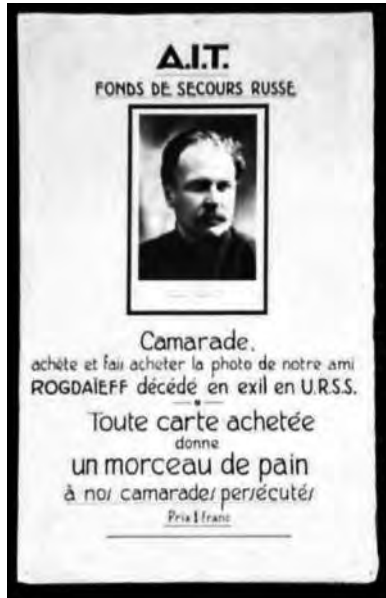
Carte de soutien aux anarchistes persécutés en Russie, publiée en France vers 1924.